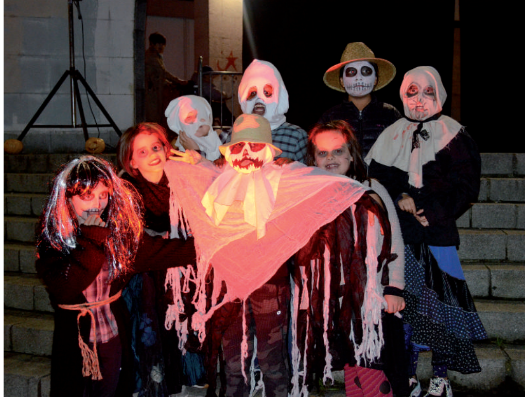
Ikastolak herriko eragileekin elkarlanean antolatzen du Gau Beltza.

Egindako lanari esker, guraso askoren konfiantza irabazi zuen Ikastolak ondorengo urteetan, eta ikasleentzako hezkuntza proiektu euskaldunaren alde jarraitu zuen lanean. Baina ez hori bakarrik, euskal kulturaz bete zituen garai hartan ikasgelak, baita hori herrira eramane ere. Argi ikusi zen Ikastolak herrian